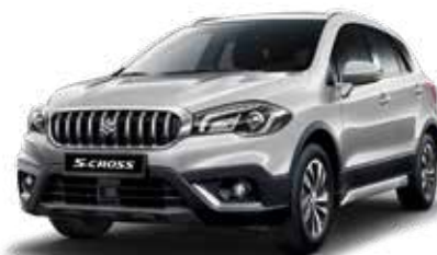
Silky Silver Metallic 2 (ZCC) Optie op Comfort, Select en Style