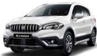
White (26U) Standaard op Comfort, Select en Style

De kleur van een auto is heel persoonlijk. Daarom is de Suzuki S-Cross leverbaar in 9 verschillende kleuren. Vind je het lastig om een goede kleur te kiezen? Kom dan langs in de showroom om de kleuren eens in het echt te bekijken, voordat je een beslissing neemt.