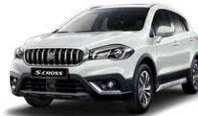
Cool White Pearl Metallic (ZNL) Optie op Comfort, Select en Style