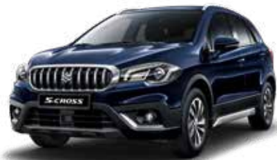
Sphere Blue Pearl Metallic (ZQ4) Optie op Comfort, Select en Style