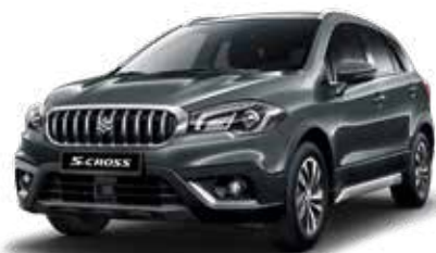
Mineral Gray Metallic 3 (ZQ6) Optie op Comfort, Select en Style