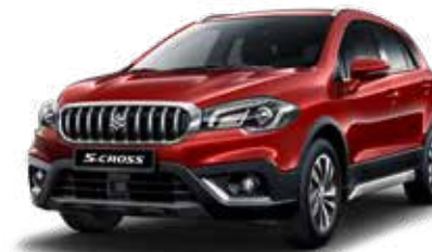
Energetic Red Pearl Metallic (ZQ5) Optie op Comfort, Select en Style

Kleuren kunnen onder invloed van het drukproces afwijken van de werkelijkheid.