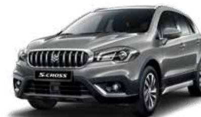
Galactic Gray Metallic (ZCD) Optie op Comfort, Select en Style