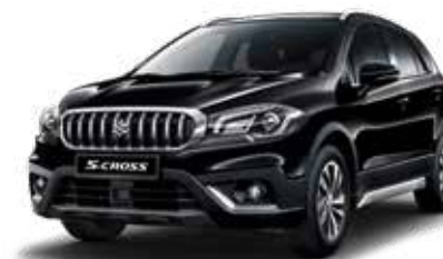
Cosmic Black Pearl Metallic (ZCE) Optie op Comfort, Select en Style