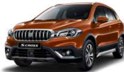
Canyon Brown Pearl Metallic (ZQ3) Optie op Comfort, Select en Style